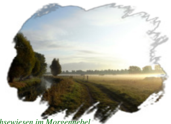
Fuhsewiesen im Morgennebel

13. Einer der schönsten Ausblicke in die Fuhselandschaft.